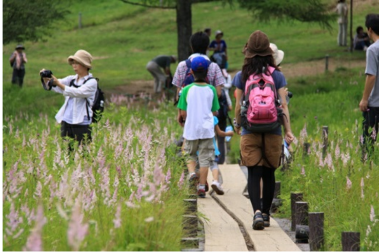
花の畑を歩いている人々